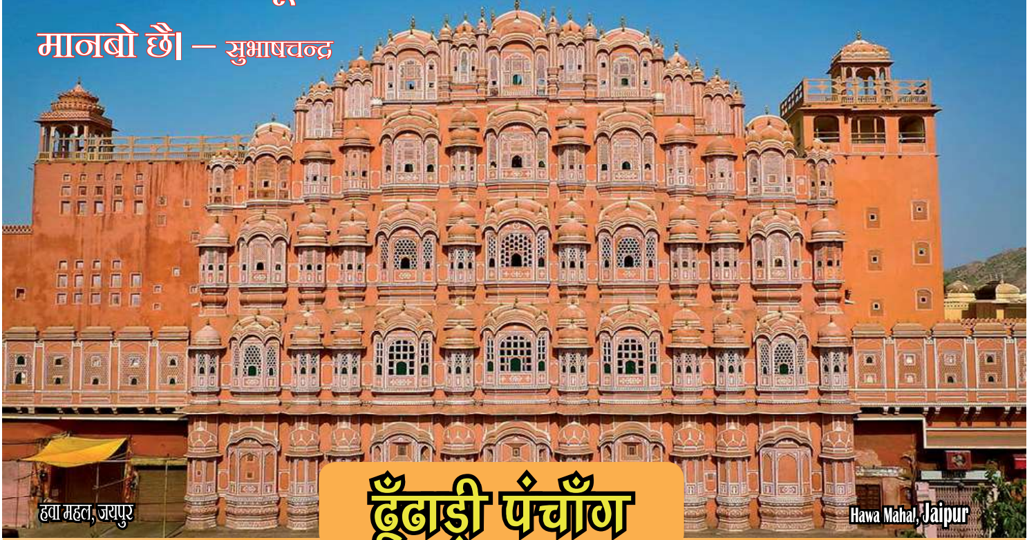
हवा महल, जयपुर