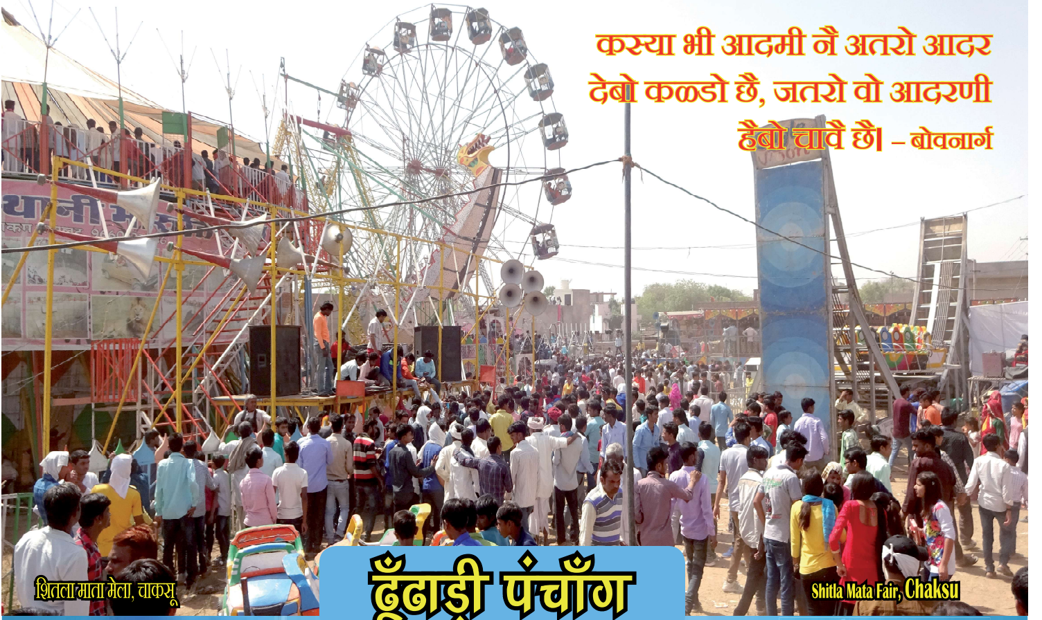
शितला माता मेला, चाकसू

कस्या भी आदमी नै अतरो आदर देबो कळडो छै, जतरो वो आदरणी हैबो चावै छै - बोवनाग