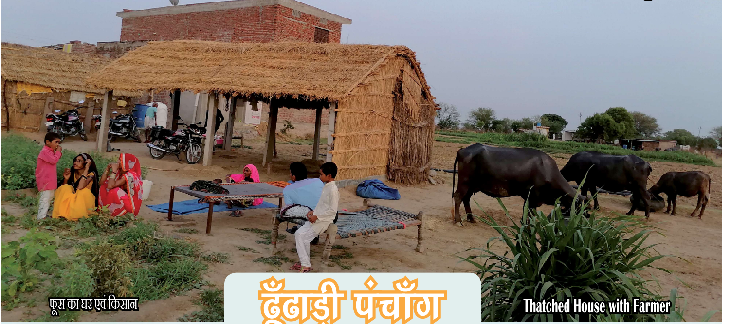
फूम का घर एवं किसान